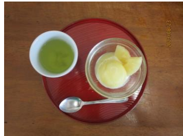
パインシャーベット