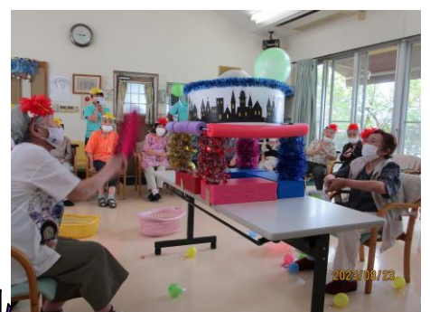
あおいで、ドッカン、バルーン花火