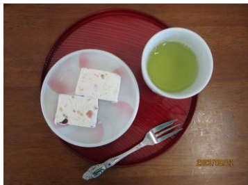
シチリア風ケーキ