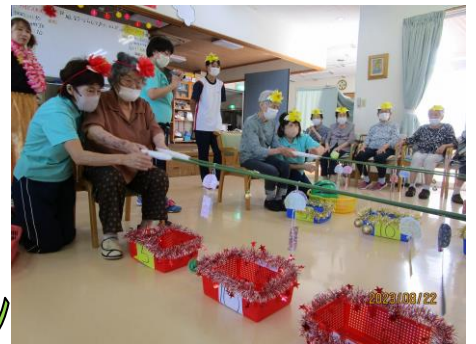
風鈴を鳴らしてリンコロポン